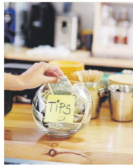
Desde 1991, los empleados que reciben propinas han estado sujetos a un subsalario mínimo de $2.13 la hora.

"Medidas como el PS 754, que pueden tener un efecto directo en la inflación, en el aumento de costos al consumidor, así como en la economía en general, merecen ser analizados concienzudamente. Es por ello que la Comisión que pre-